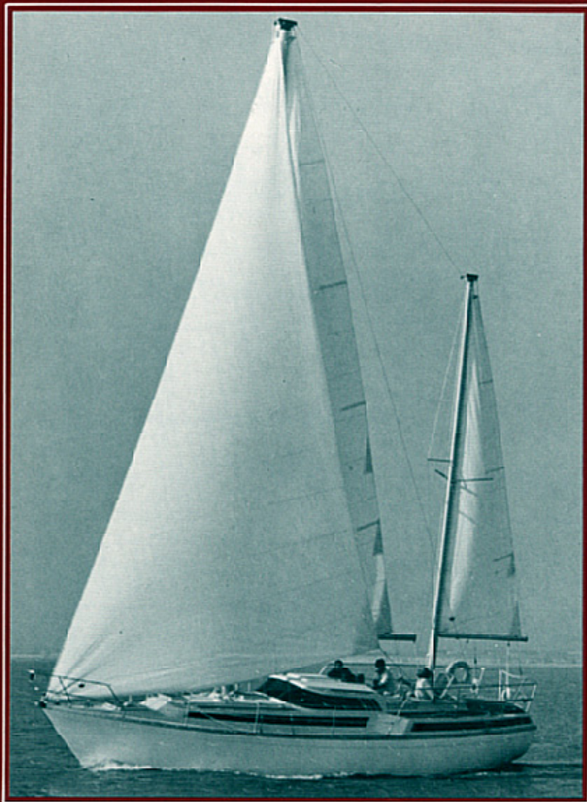
EVASION 37 BENETEAU

l'Evasion 37 a été conçu par André Bénétiau. Puissant voilier de croisière hauturière, homologué en 1 ère catégorie, équipé d'un puissant moteur, l'Evasion 37 offre un volume habitable extraordinaire. Les formes arrières généreuses, le roof important et le large tableau arrière ne nuisent en rien à l'esthétique du bateau. Au contraire.